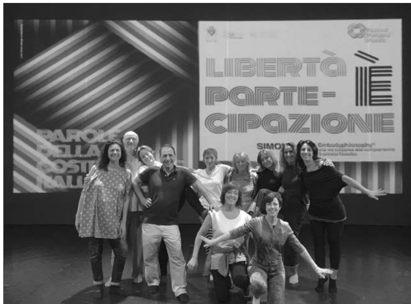
Gruppo di partecipanti