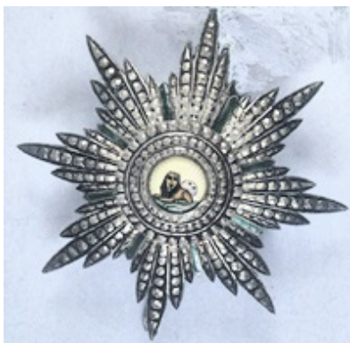
Gran Cordone dell'Ordine del Sole e del Leone di Persia