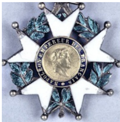
Grande Ufficiale della Legion d'Onore di Francia