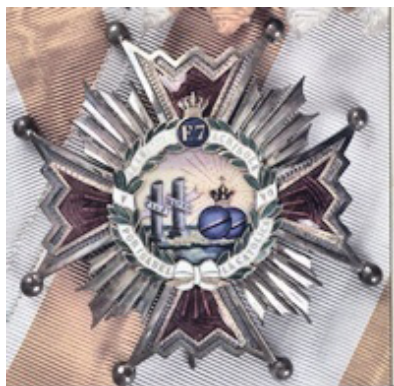
Commendatore dell'Ordine di Isabella La Cattolica di Spagna