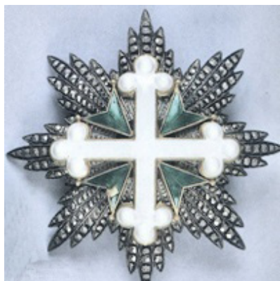
Cavaliere dei SS Maurizio e Lazzaro