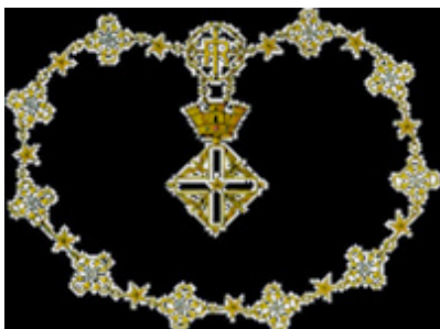
Gran Cordone dell'Ordine Mauriziano