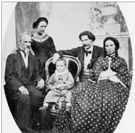
La famiglia Nigra