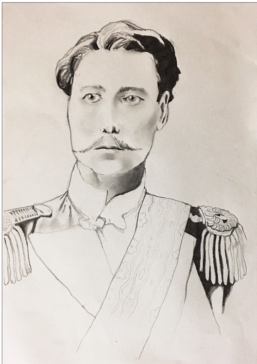
Marco Arbia - Ritratto di Costantino Nigra