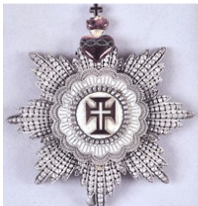
Gran Croce dell'Ordine di Cristo di Portogallo