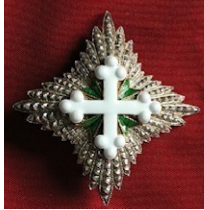
Grande Ufficiale del Regno d'Italia