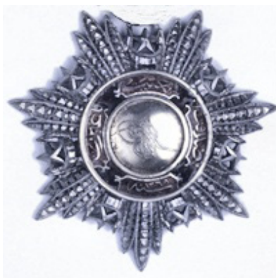
Cavaliere dell'Ordine del Medidié Ottomano