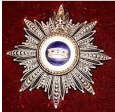
Gran Croce della Corona d'Italia