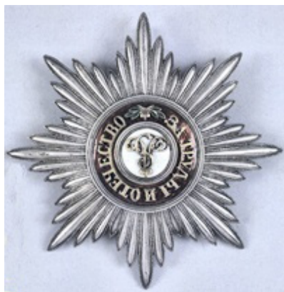
Gran Cordone dell'Ordine di S. Alessandro Newski di Russia