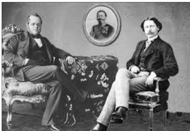
Nigra insieme a Cavour