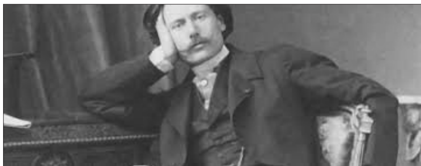
Costantino Nigra da giovane