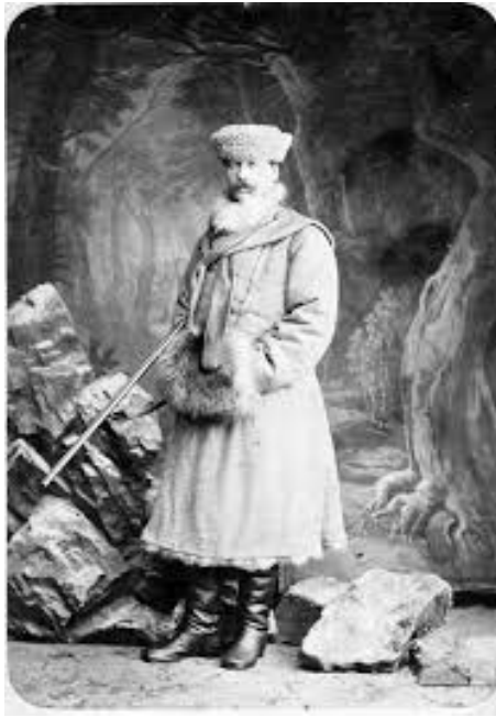
Nigra a San Pietroburgo in qualità di Diplomatico e in abiti da caccia