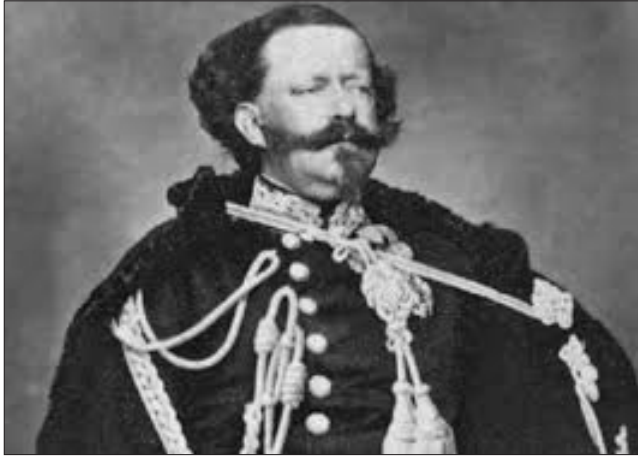
Vittorio Emanuele II