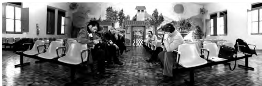
Teatro Forum. Dialogo tra attori, regista e Giolly prima dell' incontro con gli spettatori nella Casa di Reclusione di Fossombrone.