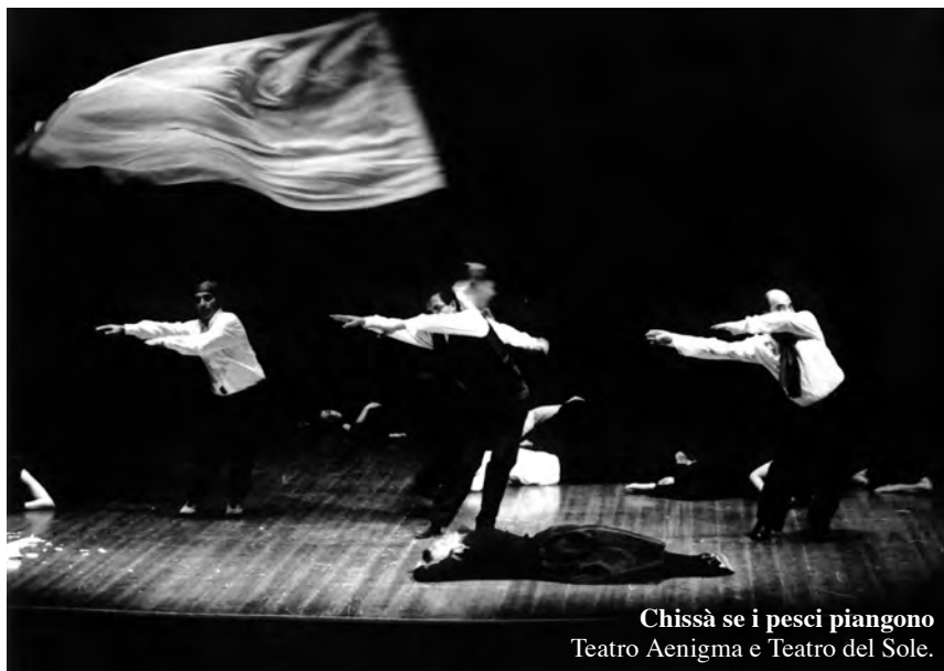
Chissà se i pesci piangono Teatro Aenigma e Teatro del Sole.