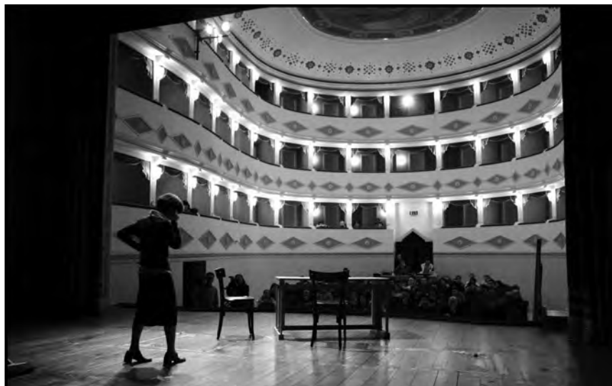
Teatro Forum. Intevengono gli spettatori presenti nel Teatro Battelli di Macerata Feltria.