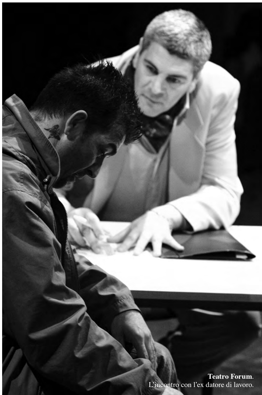
Teatro Forum. L'incontro con l'ex datore di lavoro.