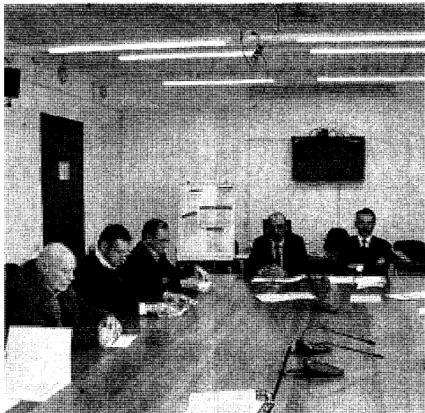
La presentazione della serie di incontri dedicati alle Marche in Europa

L'hashtag #marcheuropa è il simbolo di un'agenda condivisa per una regione europea. Lezioni, dibattiti e confronti con personalità del mondo della cultura, della politica e dell'economia per riflettere sulle Marche, oggi, in Europa. Il consiglio regionale e l'Istao (Istituto Adriano Olivetti) propongono un ciclo di seminari formativi, coinvolgendo le