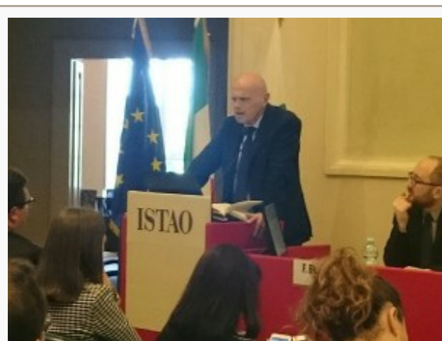
Il professor Ilvo Diamanti